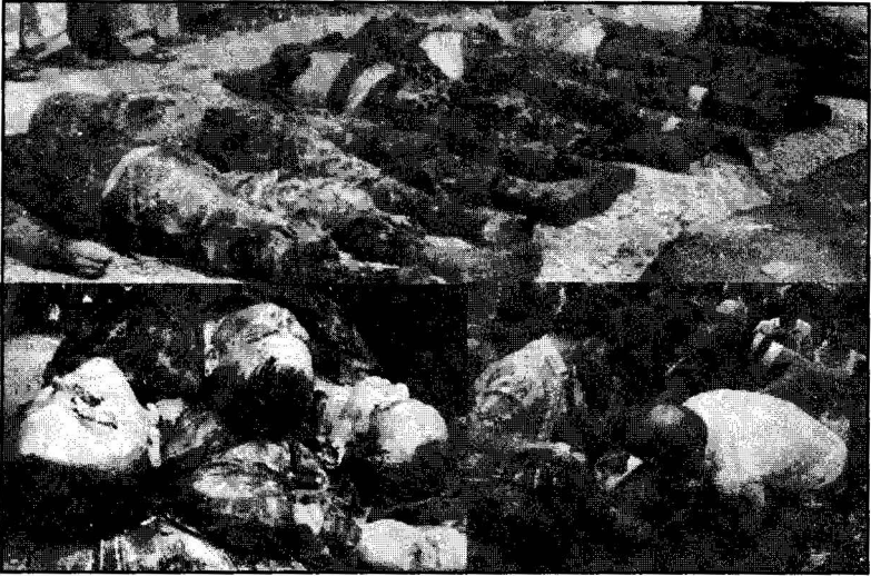
1. Army officers killed at Peelkhana and recovered at Kamrangirchar. 2. Their killers must be punished. 3. Dead bodies of the Army officers were being recovered from mass graves.