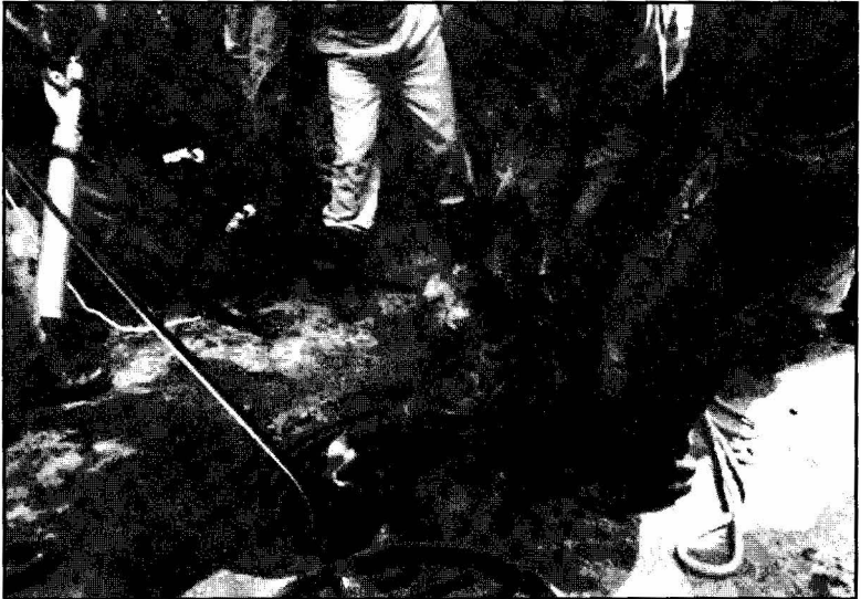
Body of the dead Army officers were being recovered from sewerage line.