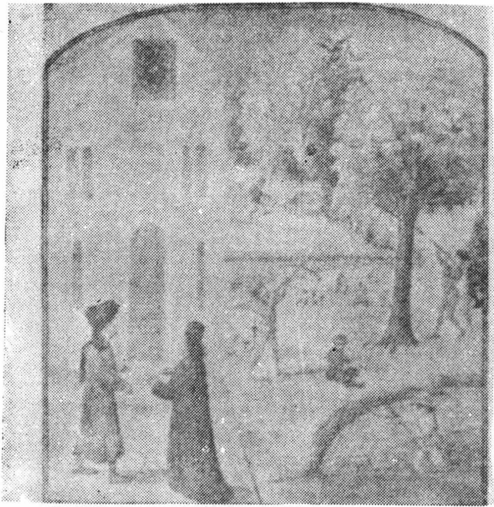
মধ্যযুগের ইউরোপে জমিদারদের জন্য পশুপাখি শিকার ও মাছ ধরার দৃশ্য ।